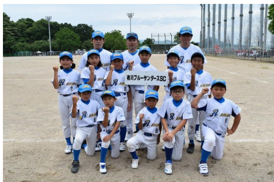
◎県大会に出場した 有川ブルーサンダーズSC