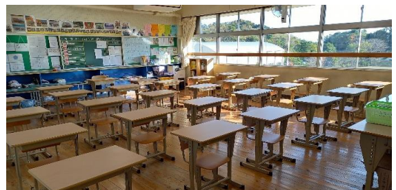
◎購入した机と椅子