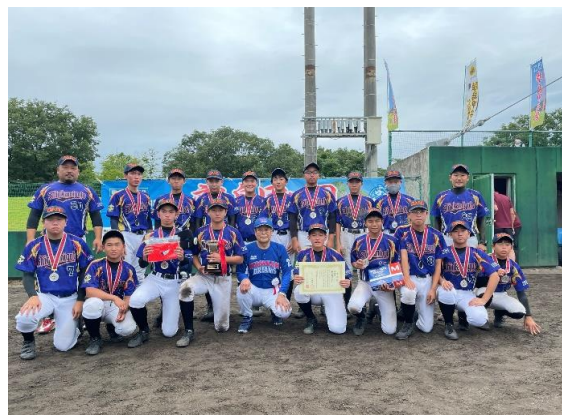
◎見事準優勝に輝いた 新上五島ファイブスターズ