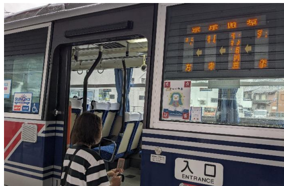
◎町民の大切な交通手段であるバス