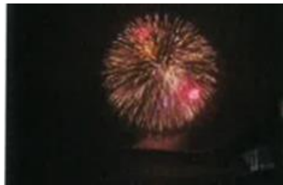
◎有川地区の花火大会