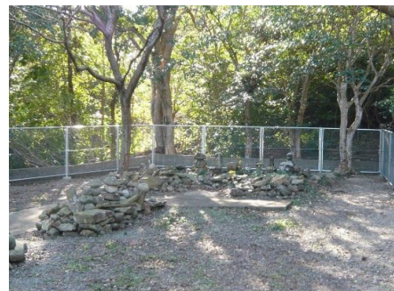
◎白魚千軒跡内の五輪塔・宝篋印塔

町指定文化財史跡の「白魚千軒塚」が、イノシシやシカ等の有蓋鳥獣の侵入により崩壊のおそれがあったため、周囲のフェンスを改修し、史跡の保護に努めました。