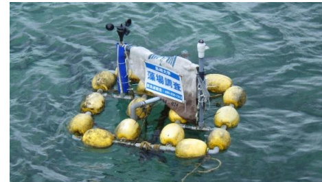
◎磯焼け対策実証実験

鯛ノ浦湾で実施した栄養塩添加実験及び有川湾に現存する藻場環境の調査結果を踏まえ、海藻の種苗生産から海域への移植に至るまでの生育状態を継続的に観察し、海藻の維持、再生産が行われるかなどを検証し、効率の良い海藻の栽培技術開発のための実証実験を行いました。