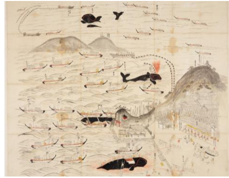
◎修理後の「肥州五嶋浦鯨突之絵図」

彩色箇所剥落止めや部分的な洗浄等の保存修理を行い、鯨賓館内に展示するための額装を行いました。