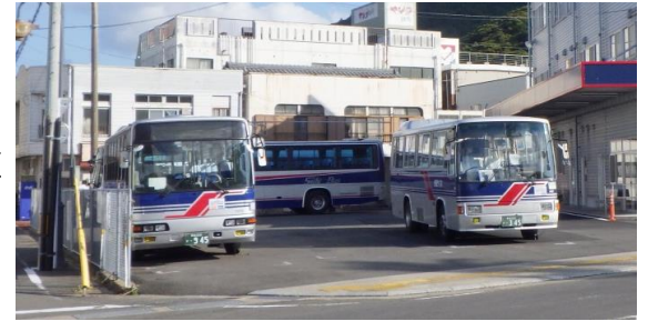
◎町民の大切な交通手段である路線バス

また、65歳以上の運転免許返納者に対し、「高齢者割引バス」1回分を無料で購入できるように補助を行い、運転免許証を返納しやすい環境を整備し、高齢者の運転事故の減少と公共交通機関の利用促進を図りました。