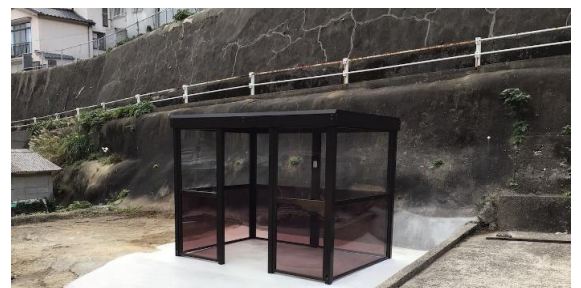
◎奈良尾地区バス待合所