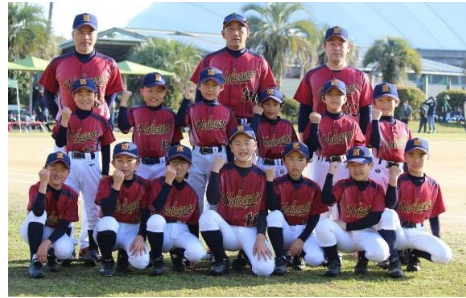
◎九州大会に出場した中五島少年チーム

また、町の代表として県大会や九州大会に出場する少年スポーツ団体や個人15件に対し、旅費の一部を助成しました。