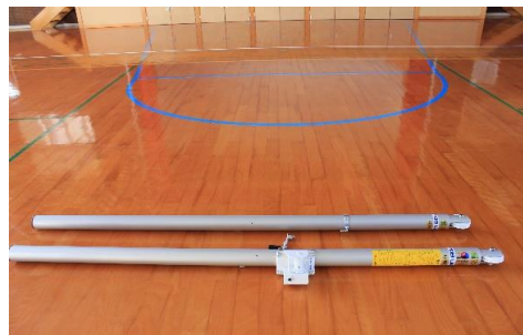
◎東浦小学校バレーボール支柱