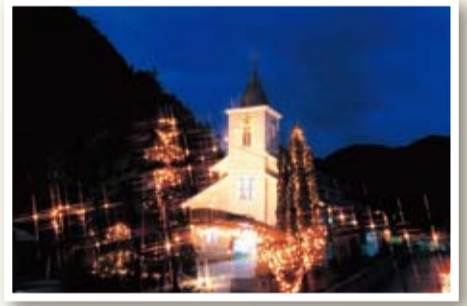
教会イルミネーション