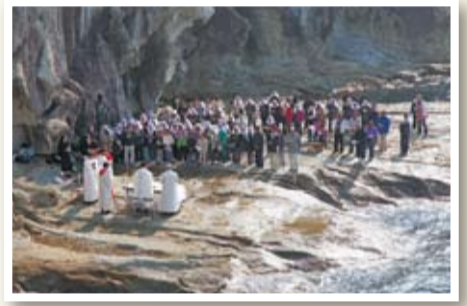
キリシタン洞窟ミサ