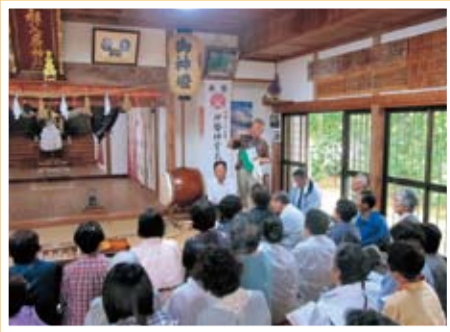
町内歴史散策 上五島歴史と文化の会